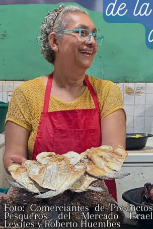
Foto: Comerciantes de Productos Pesqueros del Mercado Israel Lewites y Roberto Huembes

de la Semana del 01 al 07 de abril del 2024